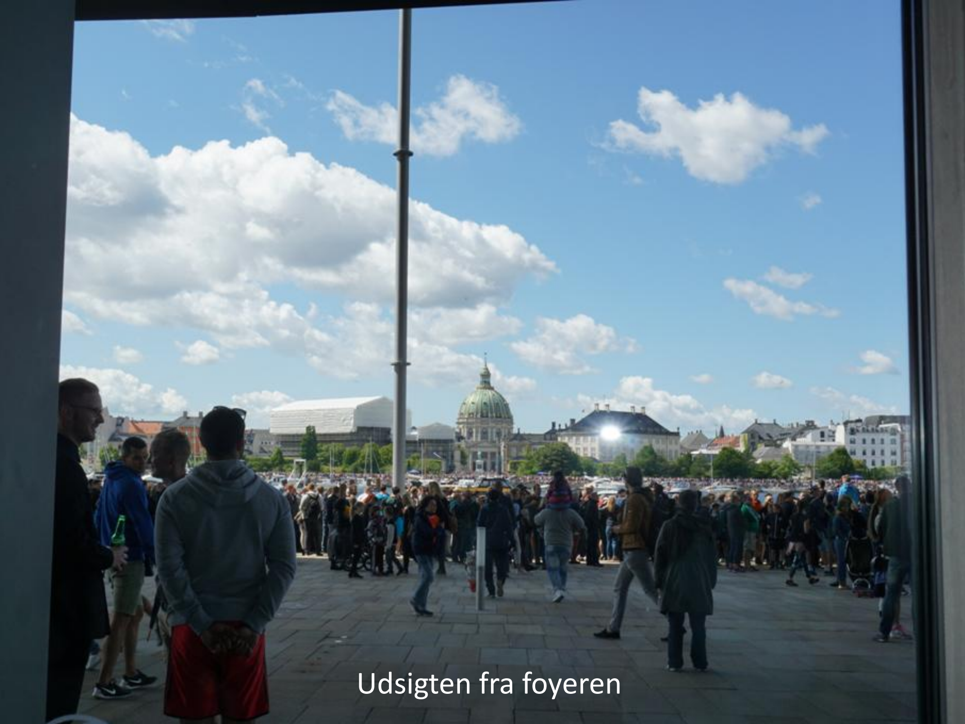
Udsigten fra foyeren