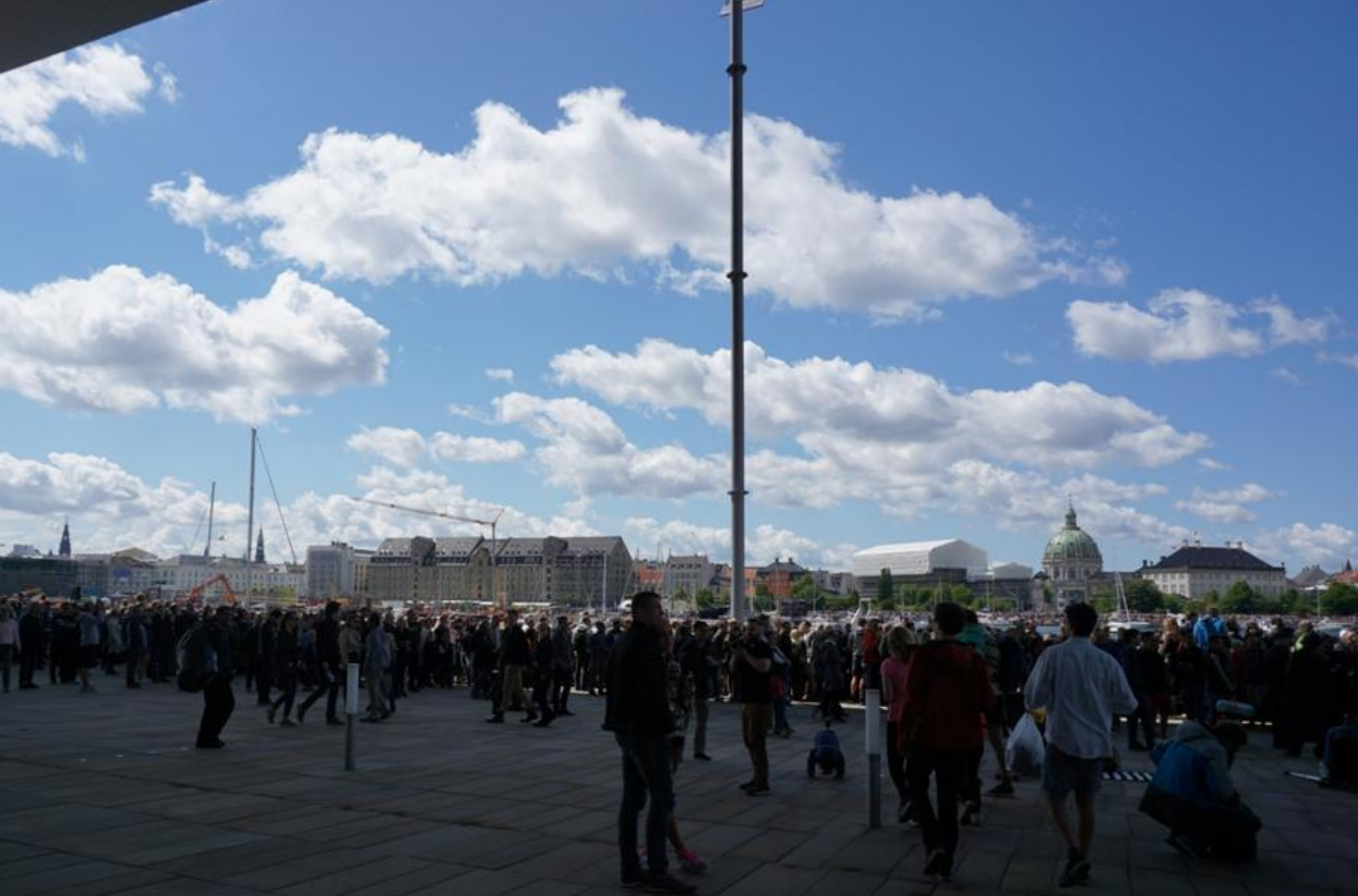
Pladsen foran operaen – alle kigger efter springerne