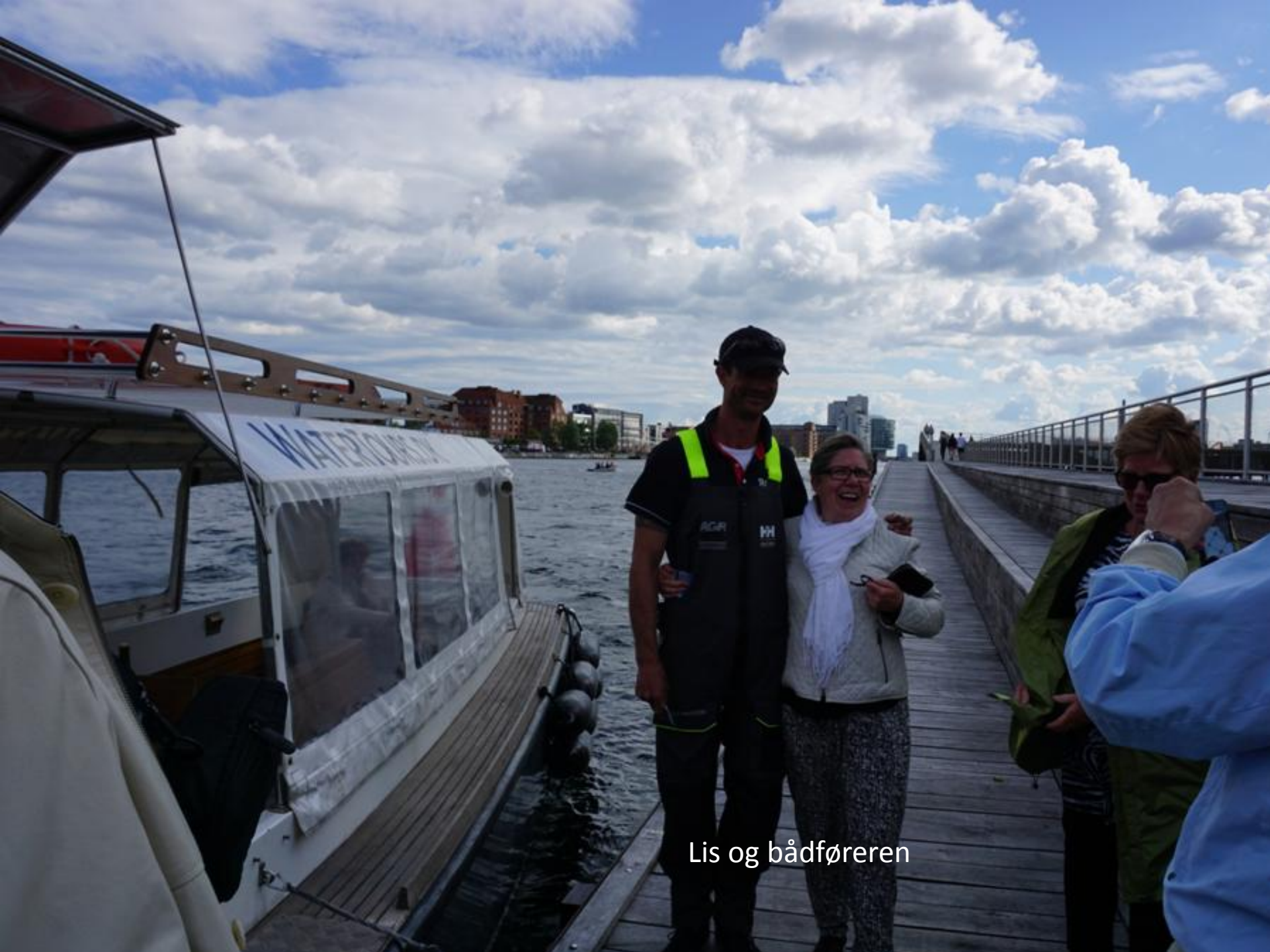
Lis og bådføreren